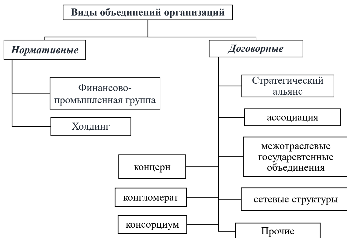
Рис. 3 Организационно-экономические формы объединения организаций

Деятельность «нормативных» объединений регламентируется законодательными актами о предпринимательской деятельности. В РФ к ним относятся финансово-промышленные группы и холдинги.